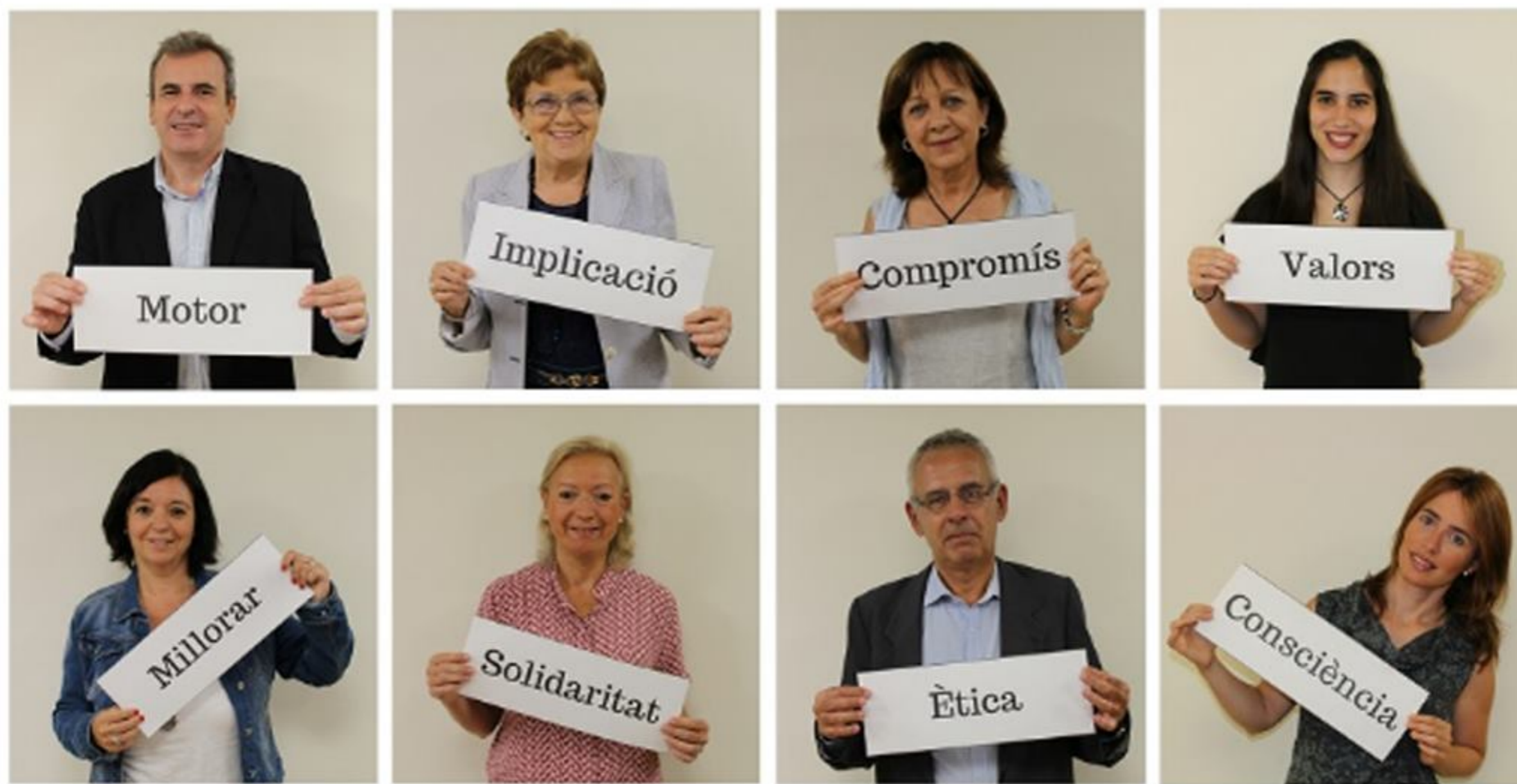
Els membres de la Comissió de Compromís Social del COFB

Nota de premsa enviada als mitjans de comunicació (també la podeu consultar a la Sala de Premsa del web institucional).