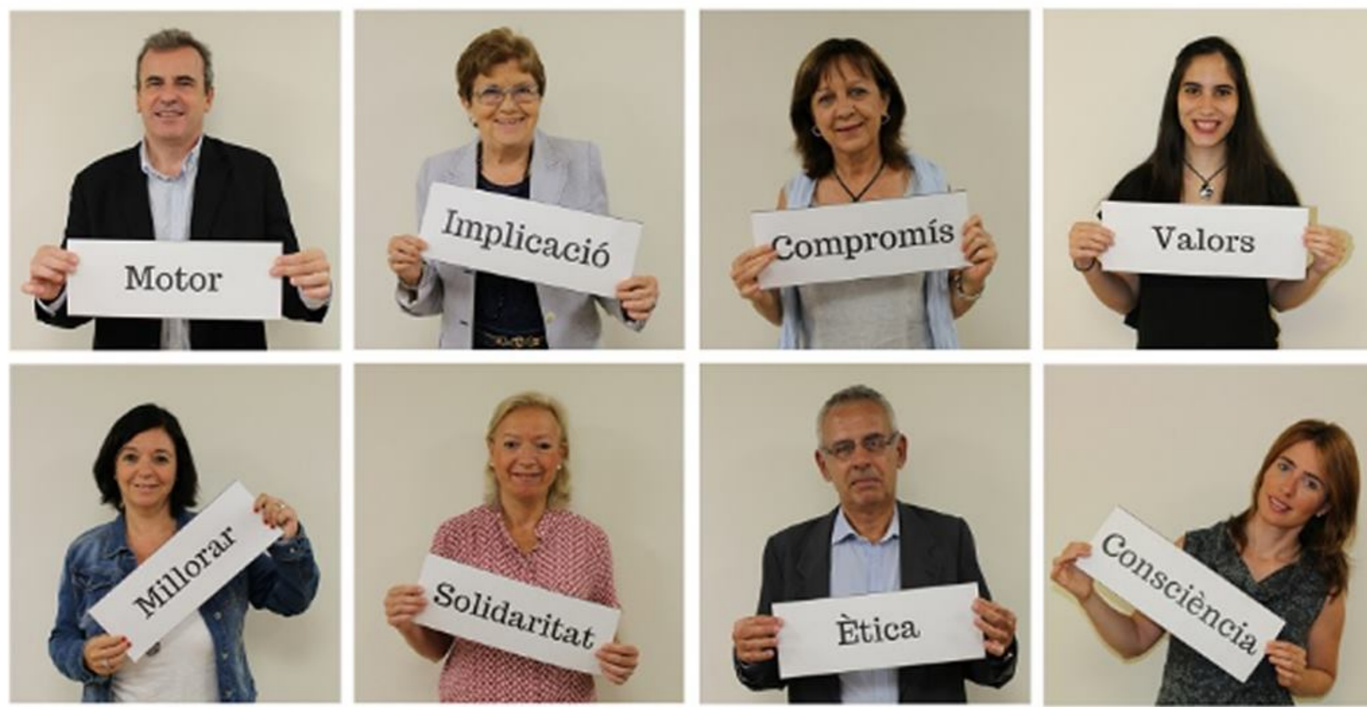
Els membres de la Comissió d'RSC del COFB

Quins projectes solidaris té el COFB en marxa? Què podem fer per aportar més valor al nostre entorn? Com podem implicar-nos en la Comissió de Compromís Social?