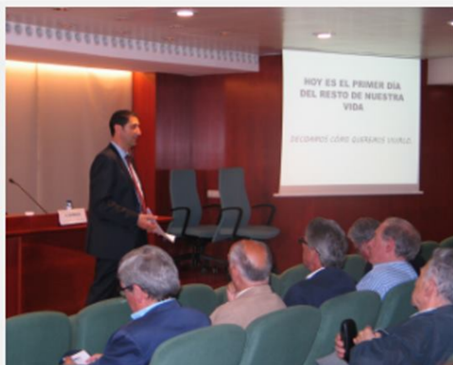
Conferència "L'actitud és el que importa" al COFB

El programa del cicle de conferències va ser el següent: