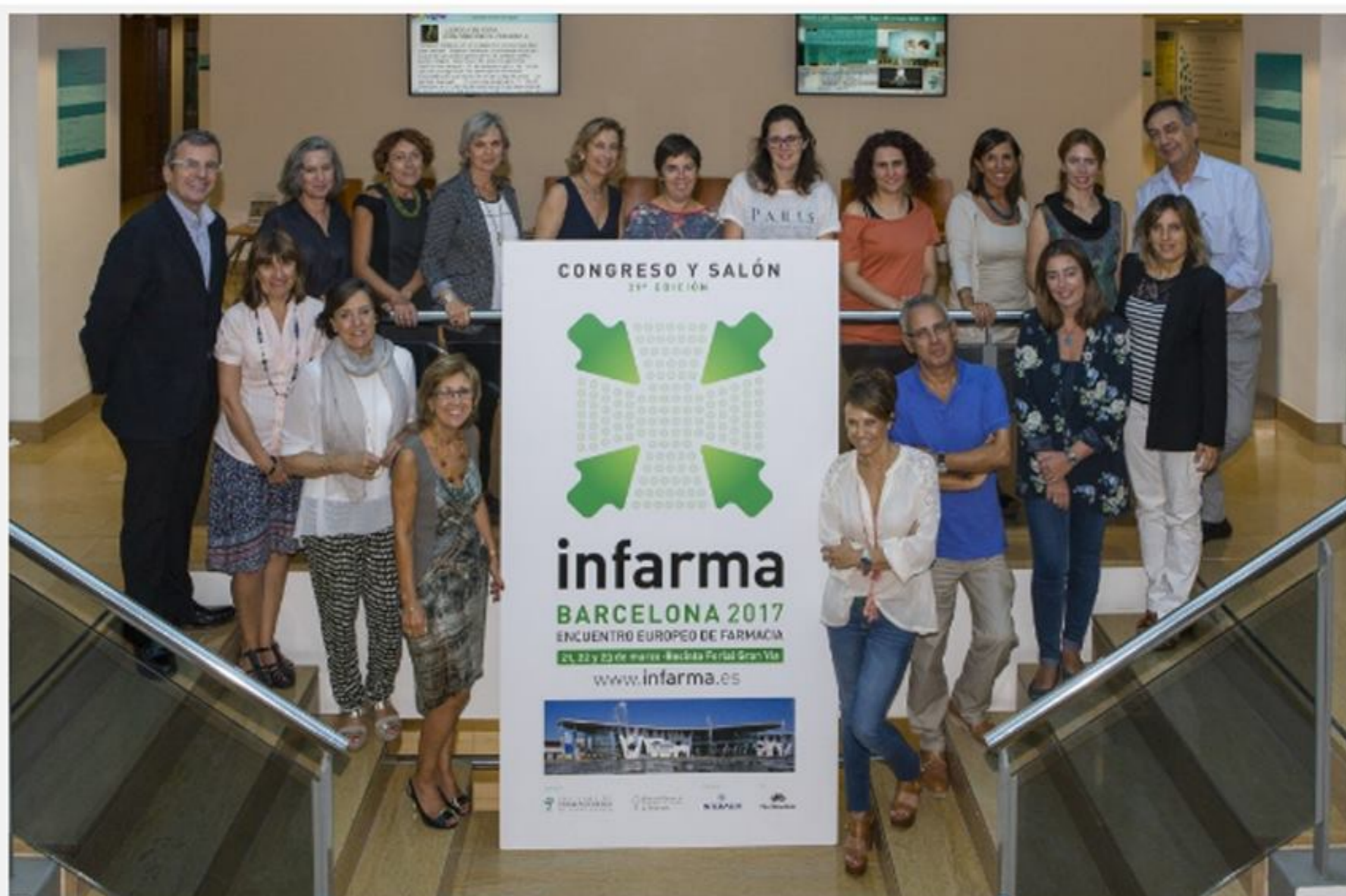
Membres del Comitè Científic d'Infarma Barcelona 2017

Infarma Barcelona 2017 també acollirà un any més el Saló de Medicaments i Parafarmàcia , en el qual les empreses del sector farmacèutic tindran l'oportunitat d'apropar-se, a través de la seva presència en estands, als milers de professionals que participaran a aquesta cita europea de farmàcia.