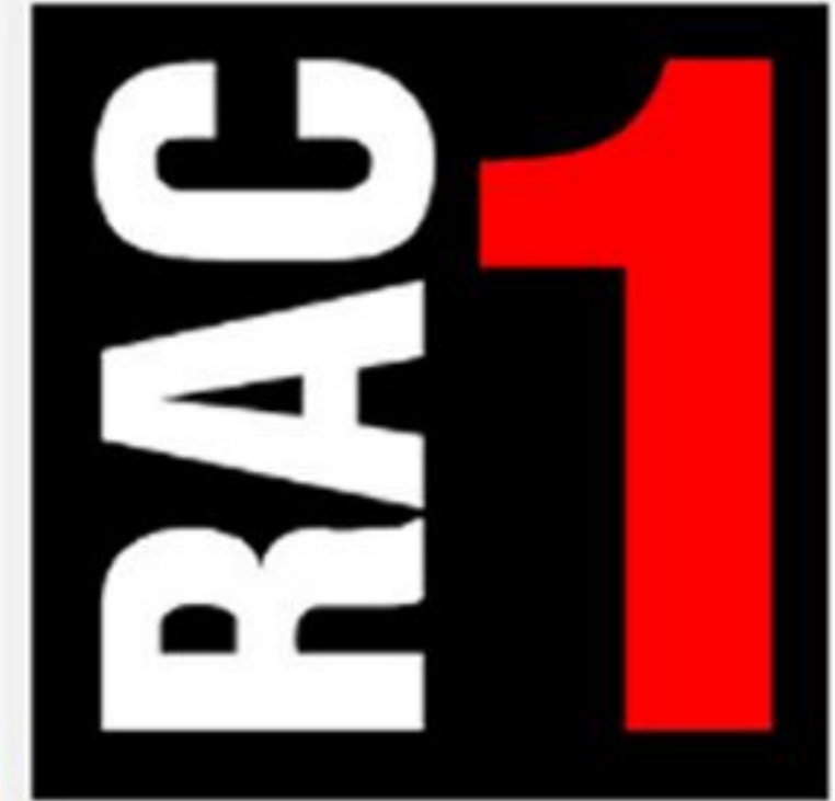
Logo de RAC1