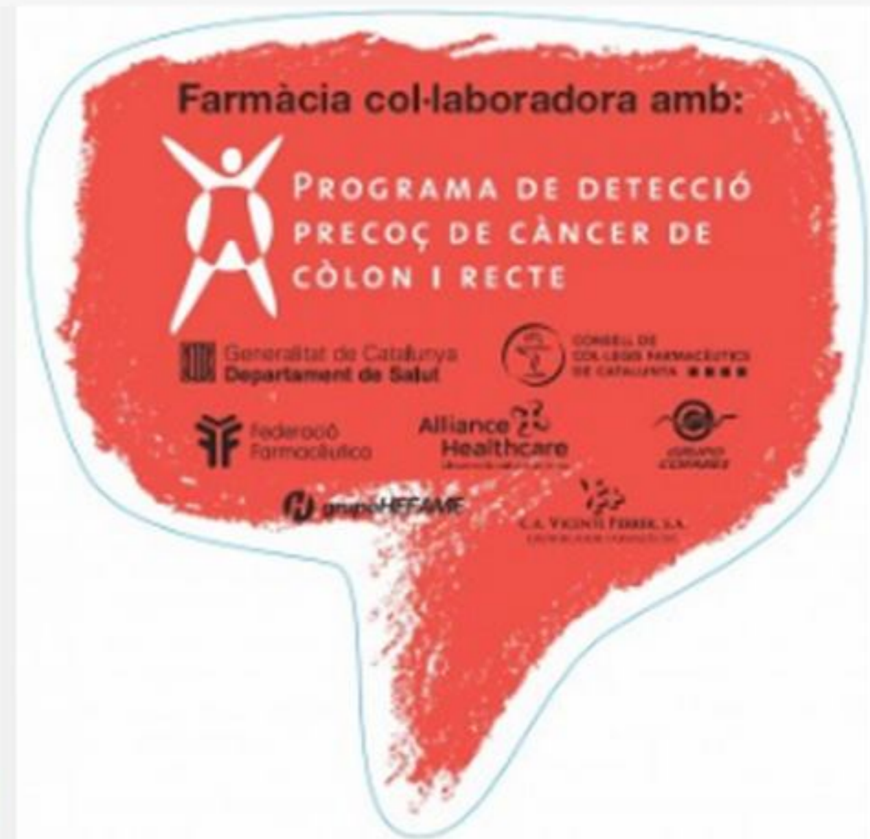
Adhesiu identificatiu de les farmàcies adherides al Programa

El Programa s'adreça a homes i dones d'entre 50 i 69 anys i consisteix a fer-se, cada dos anys, una prova senzilla i còmoda a casa per detectar si les deposicions contenen petites quantitats de sang que no es veuen a simple vista. Quan el Programa arriba a un nou barri, els ciutadans susceptibles de participar Programa rebran a casa seva una carta juntament amb un tríptic informatiu i un llistat de farmàcies participants en el Programa (que podeu consultar aquí , via el nostre web de salut, Farmaceuticonline). Per participar, l'usuari ha de portar aquesta carta a alguna de les farmàcies del llistat perquè li donin la prova. Un cop feta la prova, s'ha de retornar a la farmàcia. Els resultats de la prova li seran comunicats per carta o per telèfon.