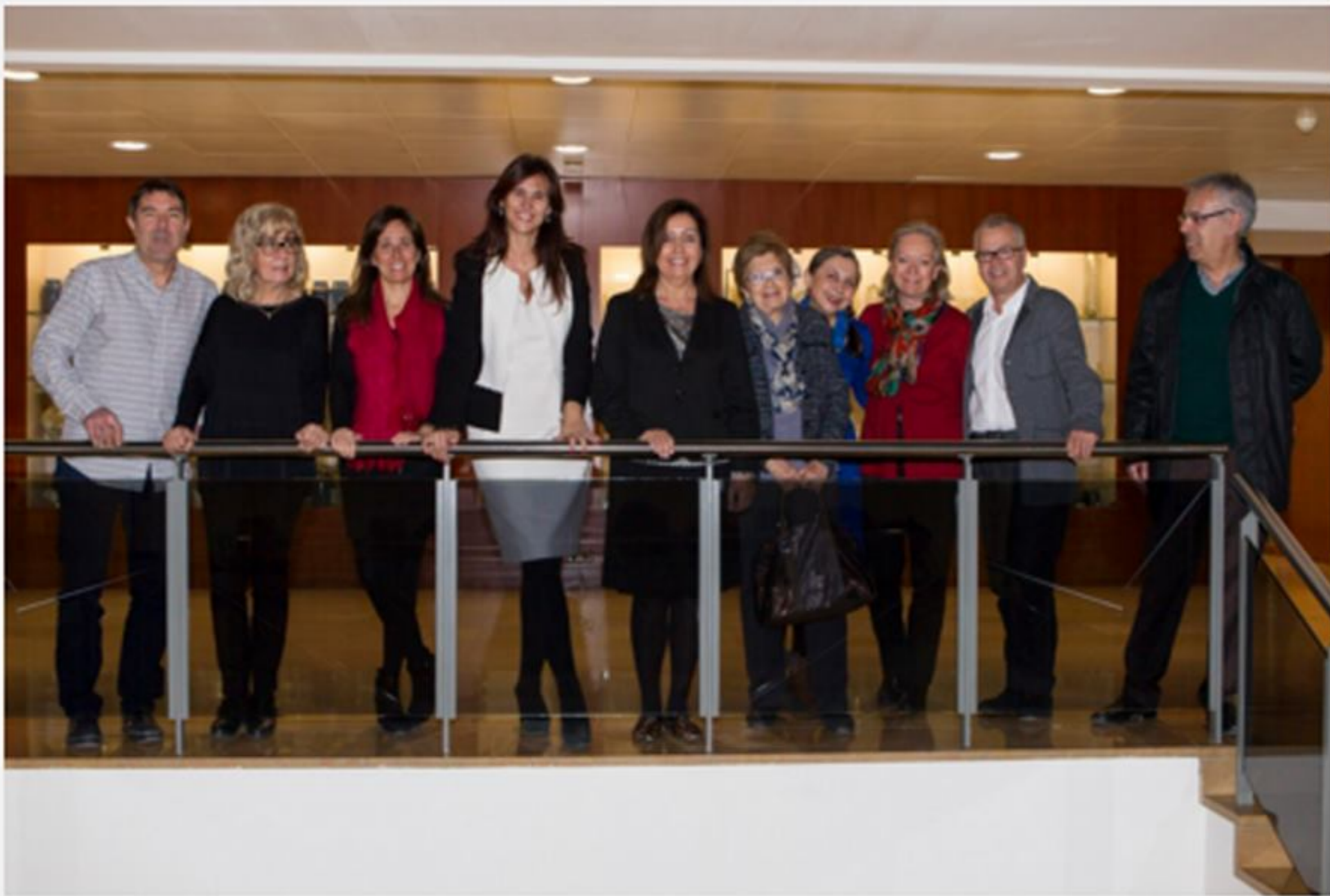
Els membres de la Comissió de Cultura del Col·legi amb Laura Borràs