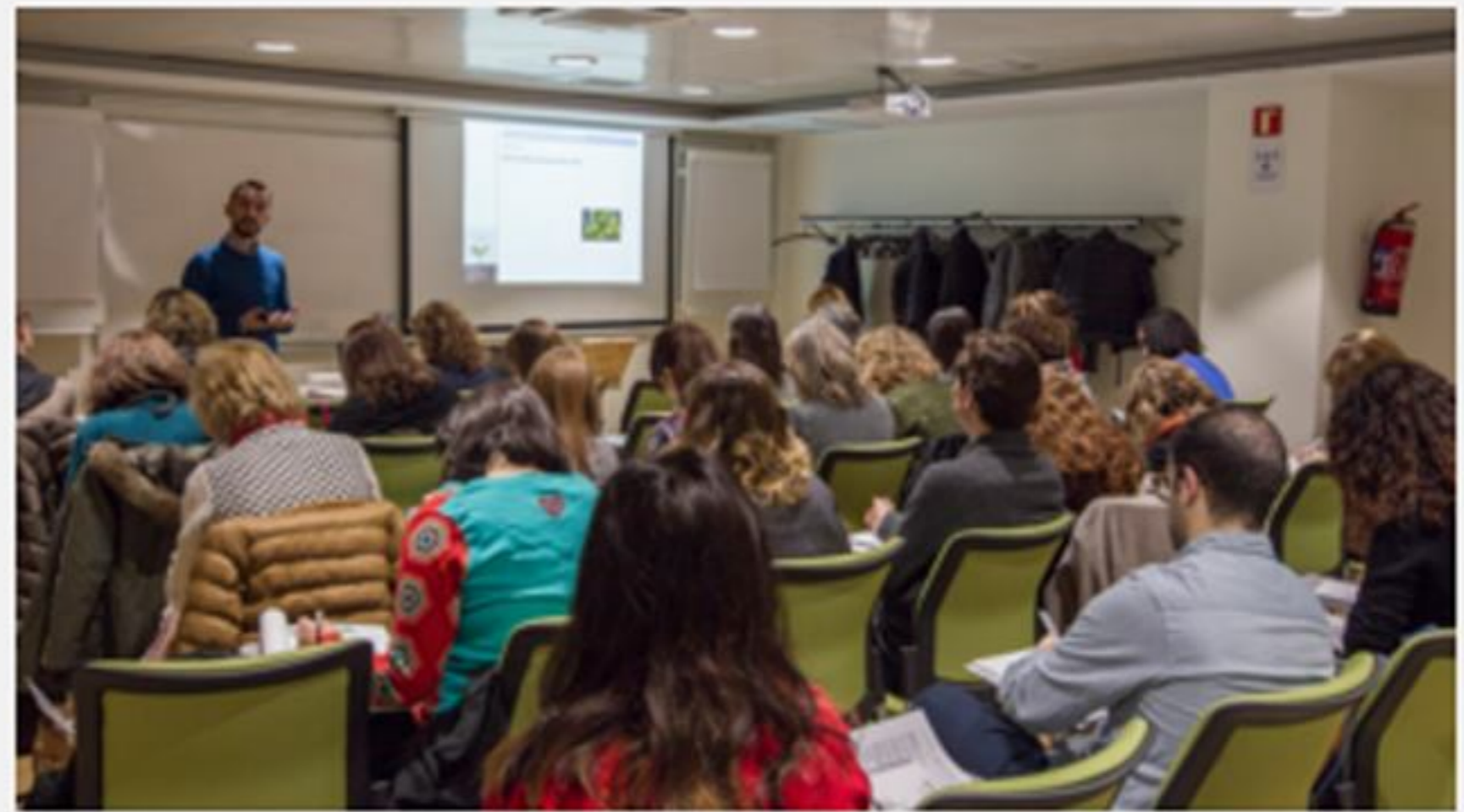
Aula del curs d'aromateràpia científica del COFB