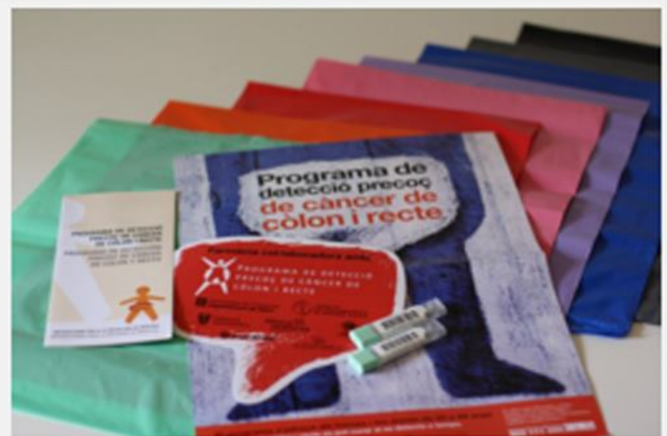
Materials del Programa de detecció precoç de càncer de còlon i recte