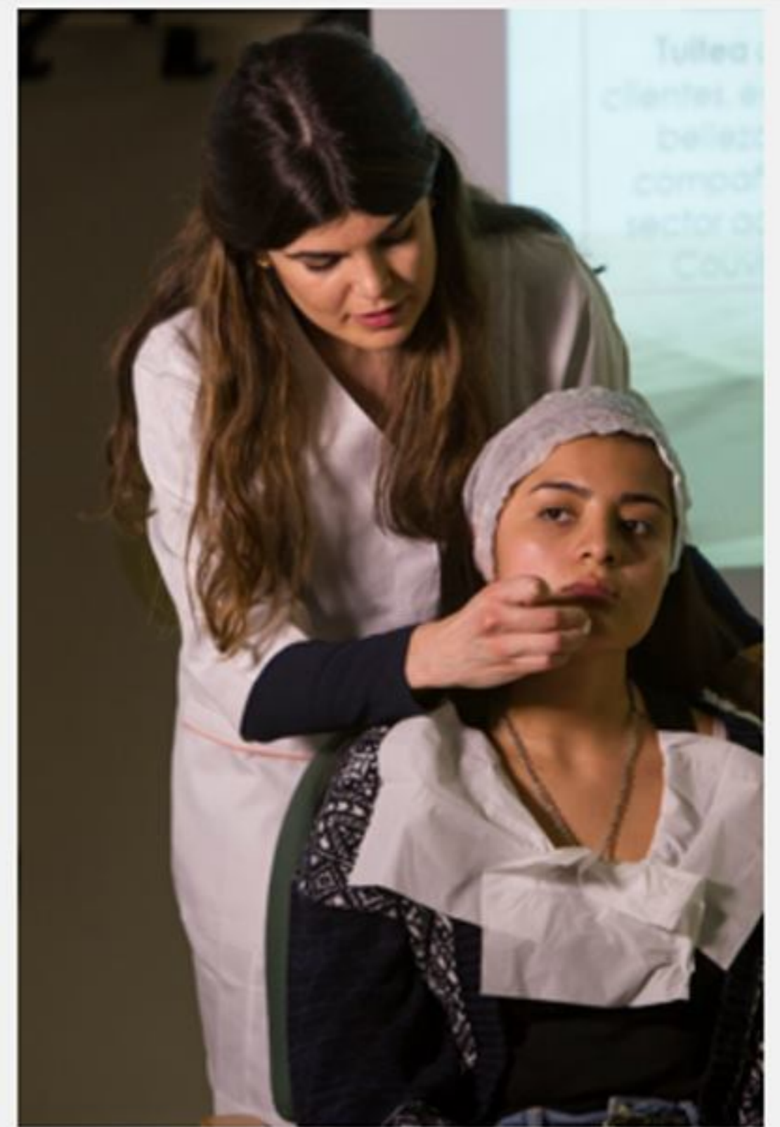
El maquillatge corrector també s'anomena camuflatge terapèutic