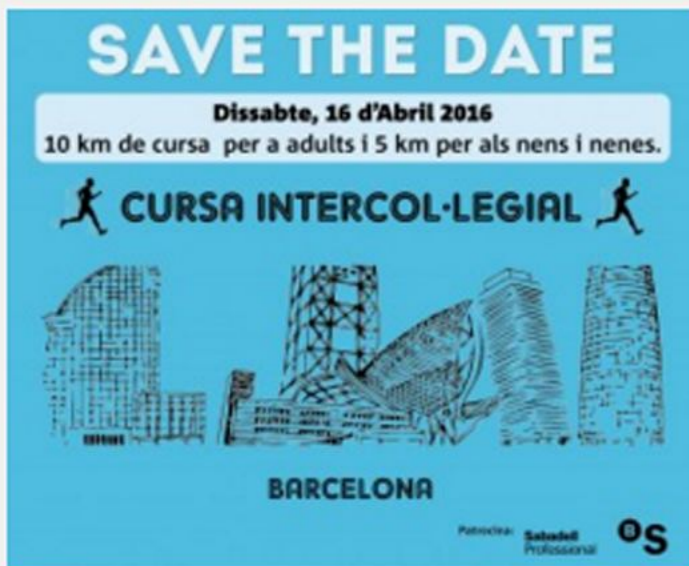
Cartell oficial de la VII Cursa Intercol·legial

El món col·legial té una cita amb l'esport d'aquí poques setmanes. Un any més, 20 col·legis i associacions de professionals de Catalunya organitzen una nova edició de la Cursa Intercol·legial que, enguany, celebra la setena edició. L'esdeveniment tindrà lloc el 16 d'abril al Passeig Olímpic del Port Marítim de Barcelona, concretament, al moll de Mestral del Port Olímpic, on es donarà el tret de sortida a les 9 hores (també serà el lloc d'arribada).