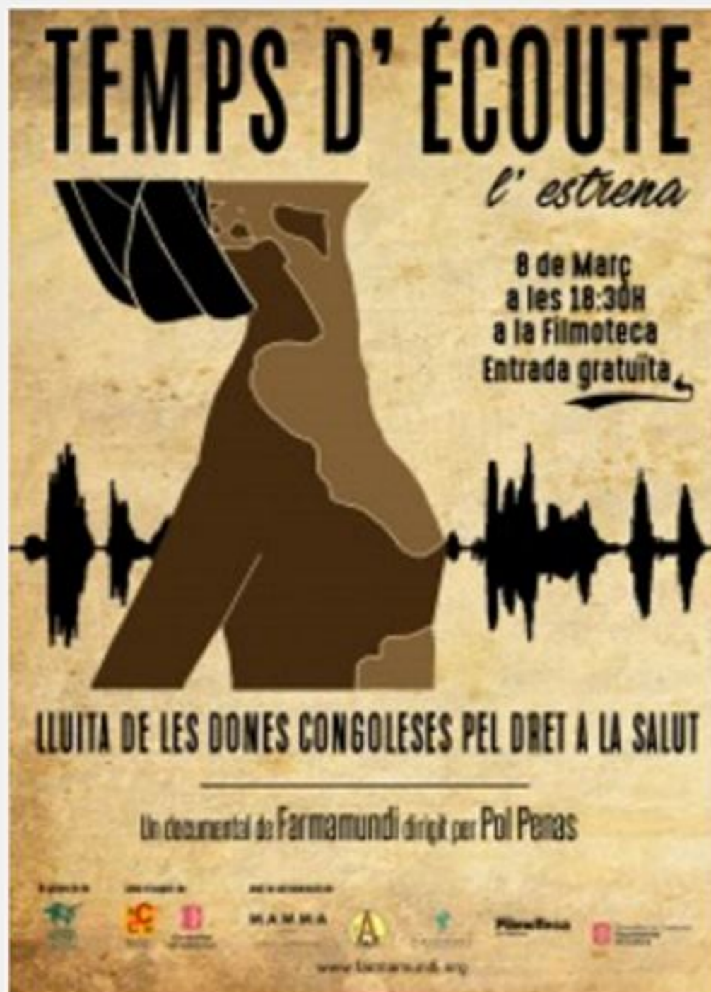
Cartell oficial de l'estrena del documental a Barcelona

El proper dimarts 8 de març, coincidint amb la celebració del Dia Internacional de la Dona , l'ONG Farmamundi estrena el documental Temps d'Écoute: lluita de les dones congoleeses pel dret a la salut . El film compta amb la col·laboració del Col·legi.