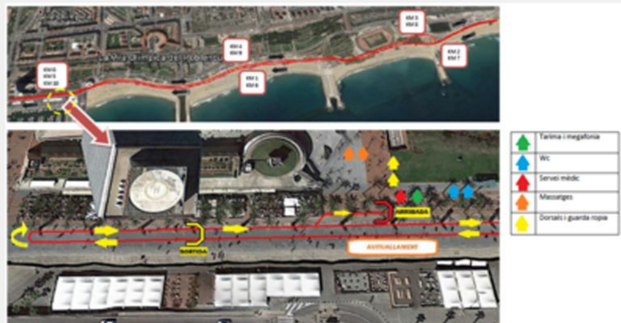
Plànol de la competició

Recordar que l'únic requisit indispensable per córrer a la Cursa és que cal estar col·legiat i inscriure's seguint el procés establert al col·legi professional al qual es pertany.