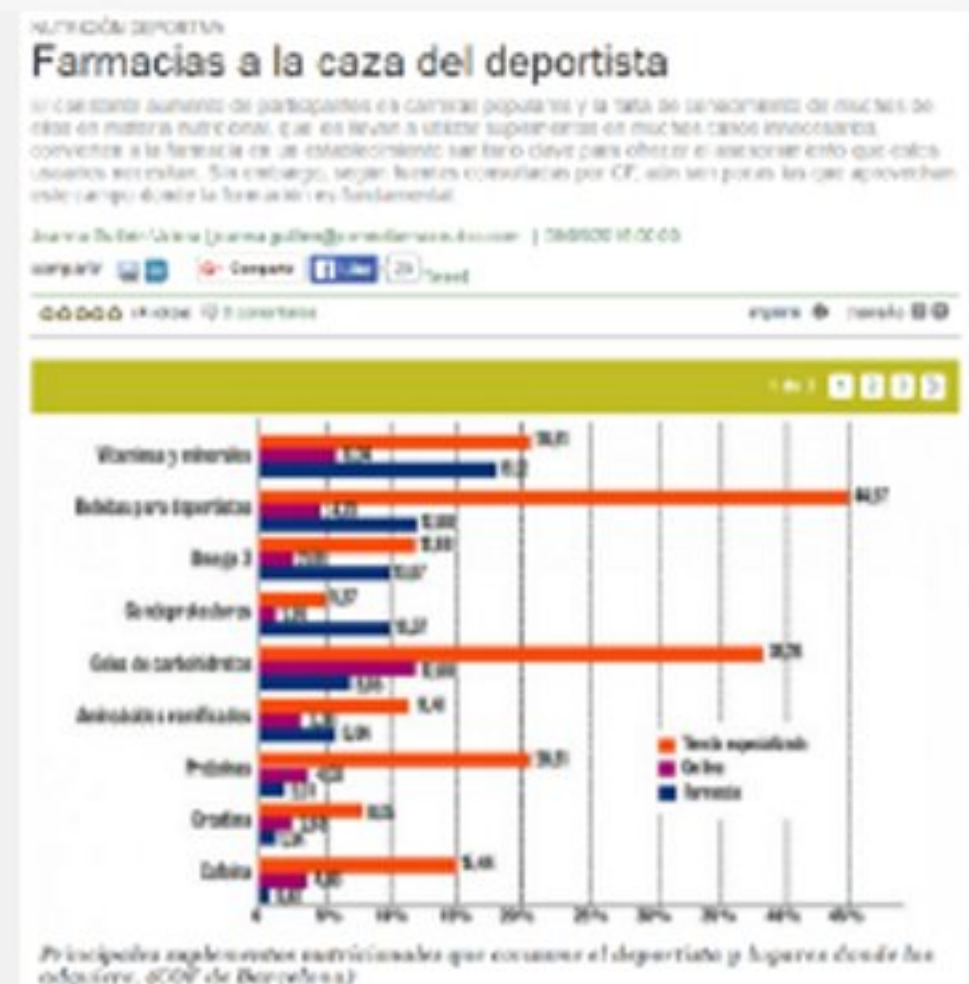
Correo Farmacéutico – nutrició esportiva