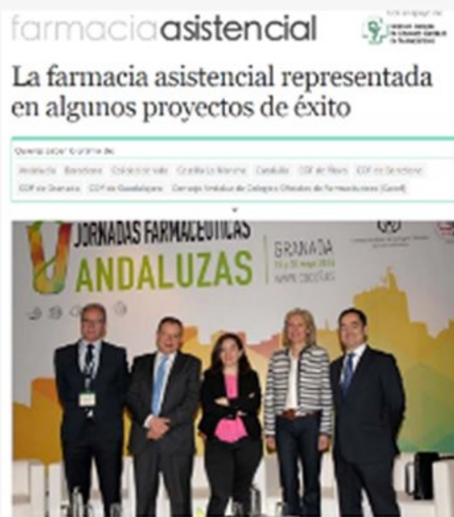
Correo Farmacéutico – Radars (Jornadas Farmacéuticas Andaluzas)