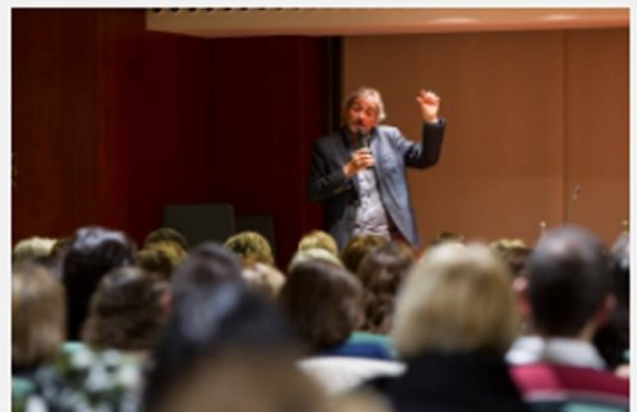
El periodista va donar claus per "educar amb humor"