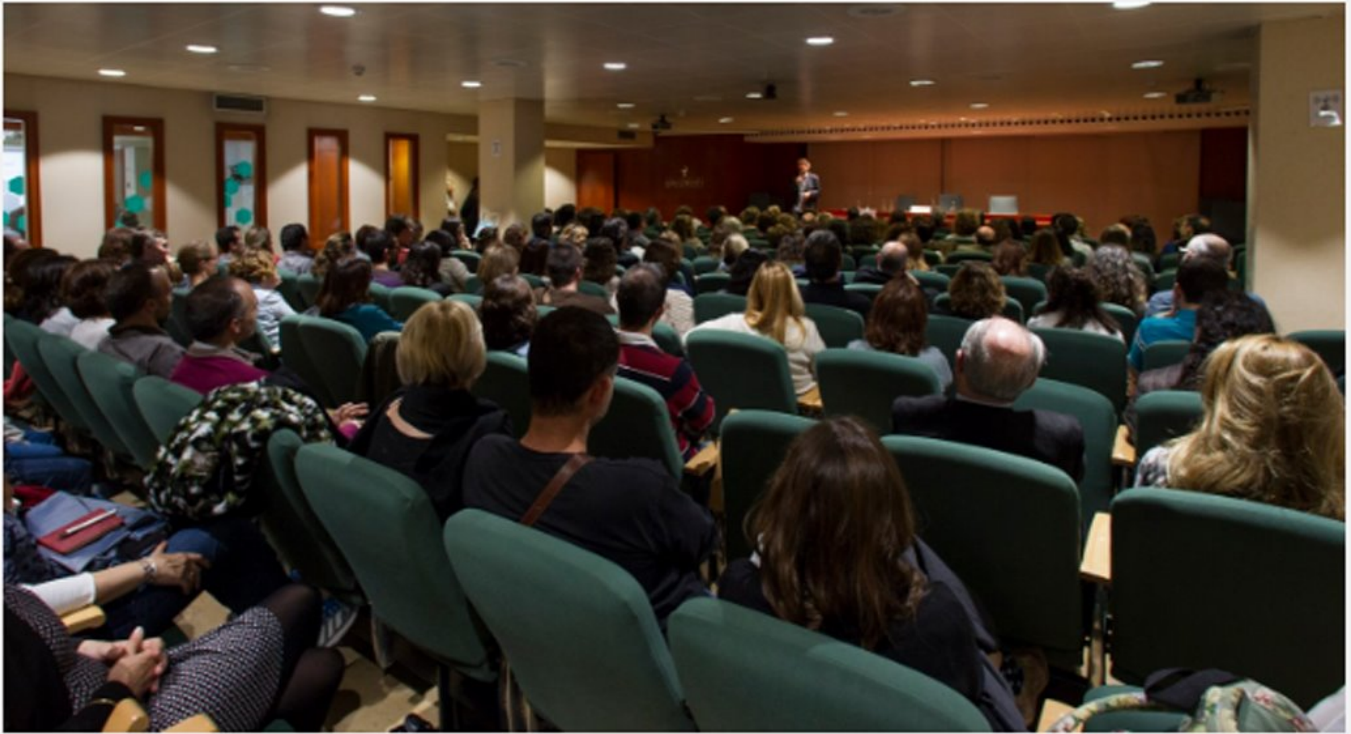
La sala d'actes del Col·legi, plena de gom a gom

Algunes imatges de la conferència que va acollir el COFB: