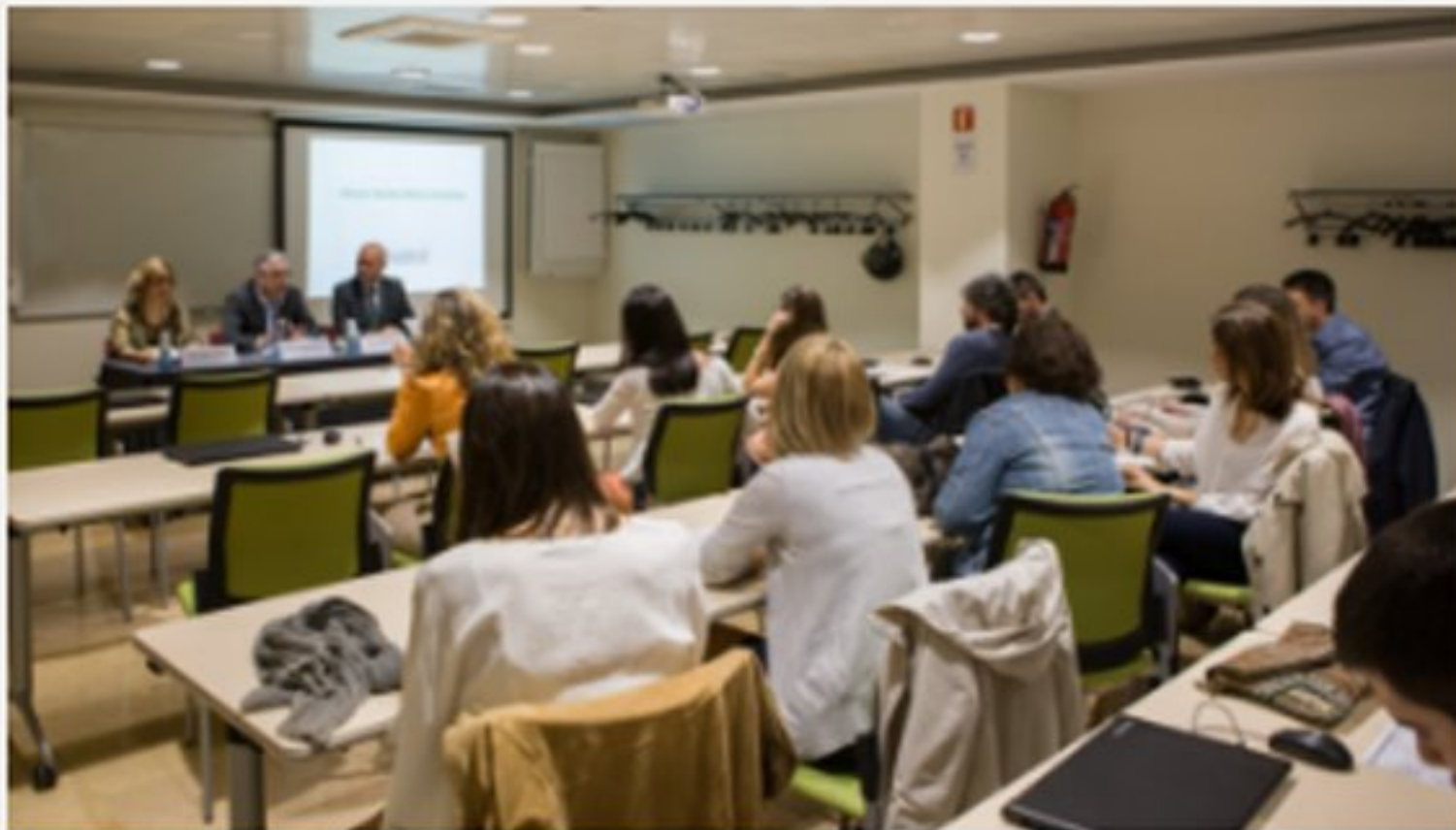
Acte de clausura del MGOF