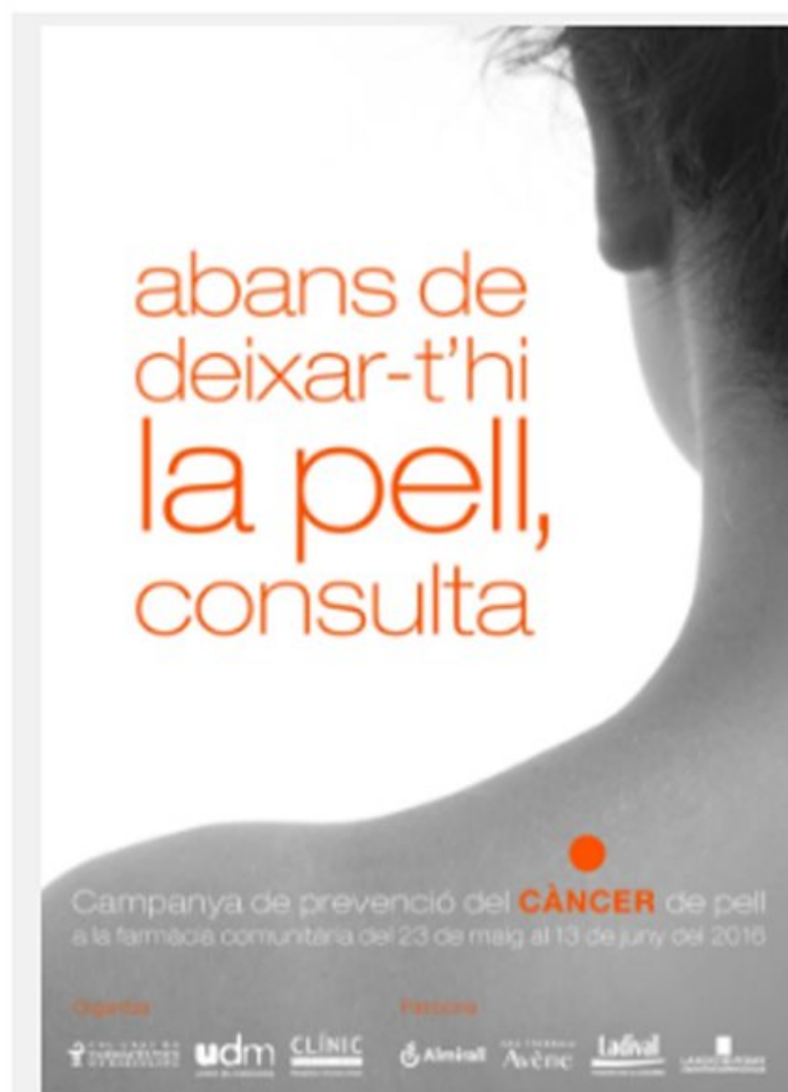
Pòster de la campanya que tenen les farmàcies que hi participen

La campanya s'està duent a terme entre el 23 de maig , Dia Mundial del Melanoma, i el 13 de juny , Dia Europeu de la Prevenció del Càncer de Pell, amb el patrocini d'Almirall, Avène, Ladival i La Roche-Posay. Durant aquests dies, els ciutadans poden anar a les farmàcies participants per tal que avaluïn els seus factors de risc de patir càncer de pell . Mitjançant un breu qüestionari amb preguntes relacionades amb antecedents familiars o el control dermatològic que segueixen, i després d'avaluar si el participant té més de 10 lesions pigmentades en un braç, el farmacèutic -format prèviament en aquest camp- l'orienta sobre les mesures de prevenció en funció del seu risc. En cas que no presenti risc , se li entrega un fulletó amb consells sanitaris sobre com protegir-se del sol adequadament i no estar exposat als seus efectes perjudicials; en cas que existeixi un risc , a més dels consells sobre protecció solar, se li recomana una revisió mèdica per fer un seguiment .