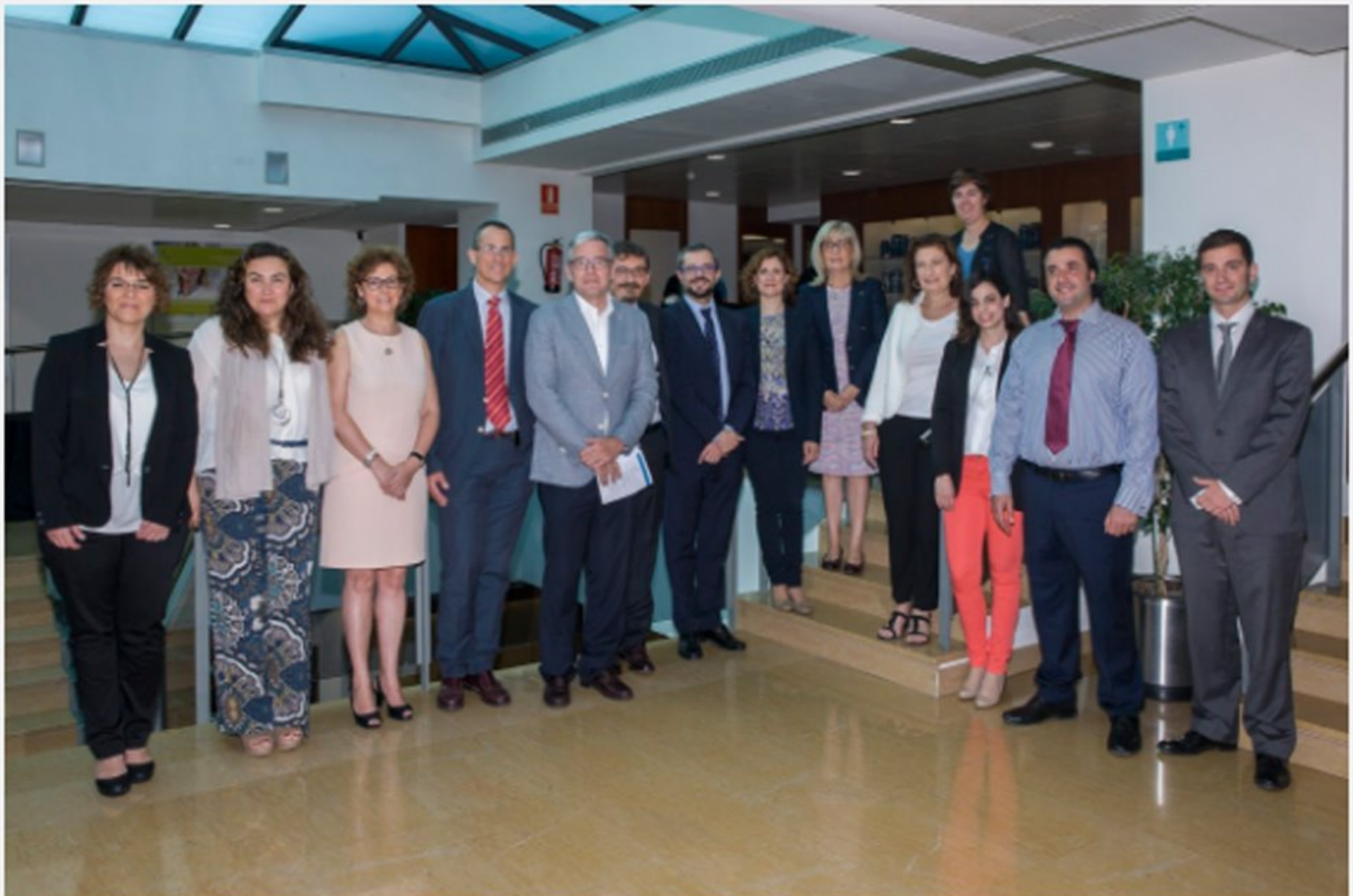
Foto de grup del participants a la Jornada de Distribució que va acollir el COFB

Nota de premsa enviada als mitjans de comunicació (també es pot consultar a la Sala de Premsa del web institucional www.cofb.org )