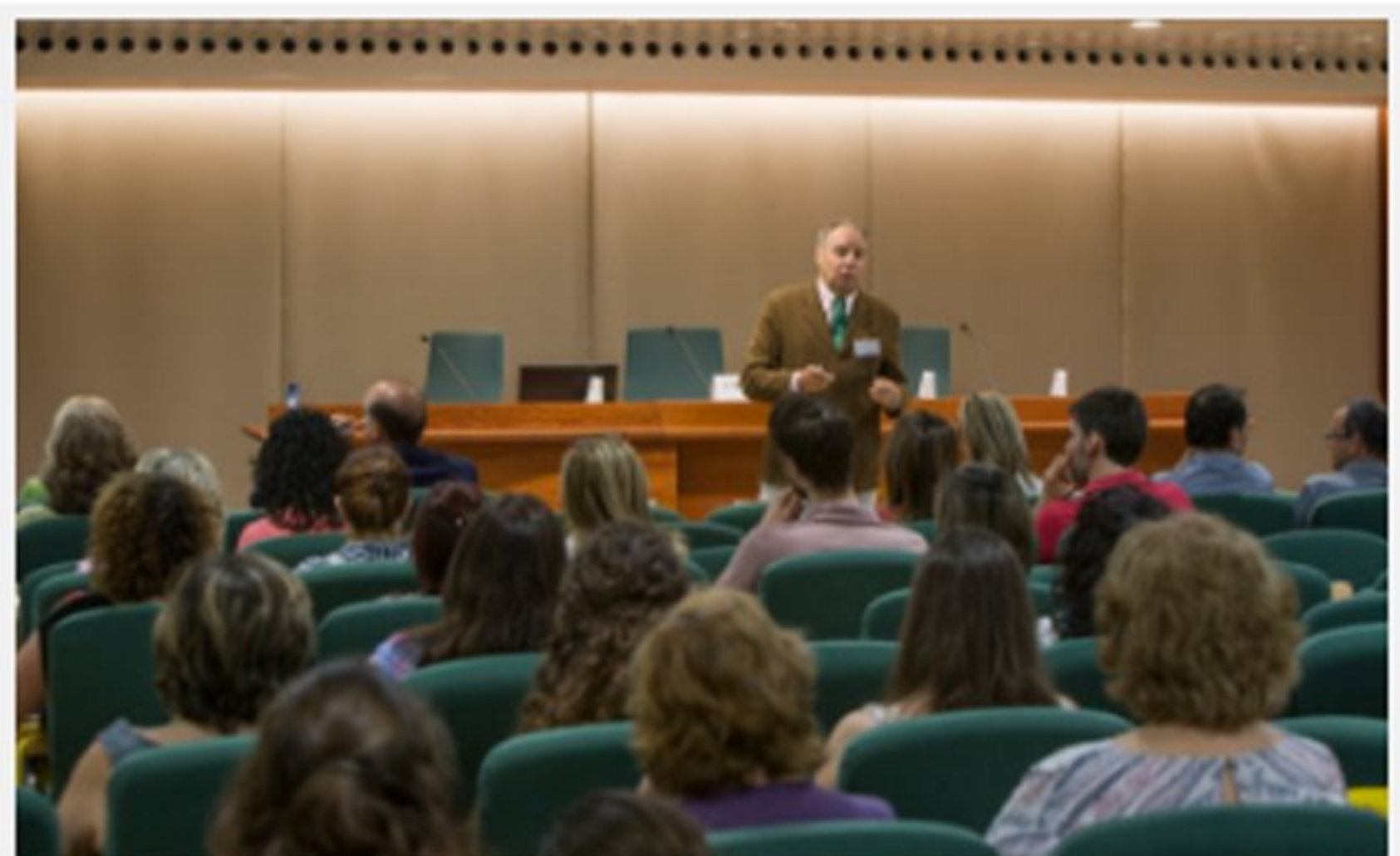
Conferència inaugural del dermatòleg Agustín Alomar

Al llarg de la jornada, també es van abordar altres àmbits en els quals la formulació pot ser útil. Aquest és el cas de l' otorinolaringologia , camp en el qual, tal com va explicar el Dr. Miquel Conti, les composicions que inclouen àcid hialurònic ajuden a protegir i hidratar les mucoses. A l'acte "Casos pràctics en formulació" també es va aprofundir sobre què poden aportar les fórmules magistrals en oncologia , posant com a exemple la radiodermatitis i la importància d'individualitzar tractaments que s'adaptin al tipus de