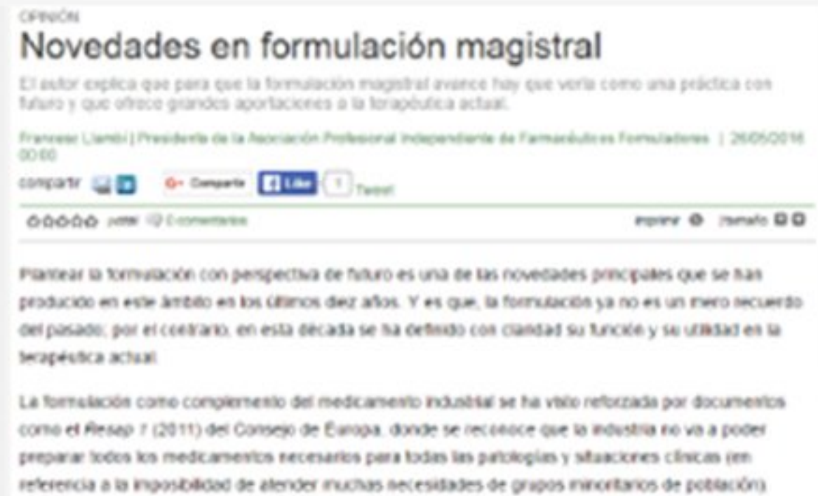
Correo Farmacéutico – Formulació magistral

El Farmacéutico va fer una prèvia sobre el Fòrum Aprofarm que es va celebrar el 10 de juny al Col·legi. Aprofarm compleix aquest 2016 20 anys i el lema que va acompanyar la IX edició del fòrum va ser "20 anys al costat del formulador".